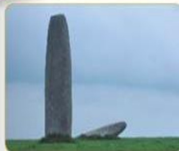
MENHIR. Enorme piedra alargada colocada en vertical y con su parte inferior enterrada.