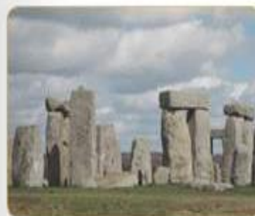
CRÓMLECH. Varios menhires en círculo clavados en el suelo.